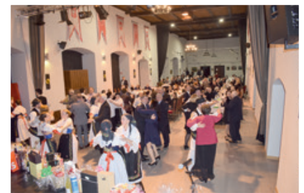
Ugodno raspoloženje pri cijeloj noći