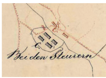
A Stájerházak első ábrázolása az 1837. évi erdészeti térképen

A Stájerházak – legalábbis egyik épületének – keletkezéséről tehát pontos adatokkal rendelkezünk, azt is tudjuk, hogy első lakója nem Stájerországból, hanem Alsó-Ausztriából érkezett. Az is bizonyos, hogy a szakszerűen felügyelt erdőgazdálkodás kezdete, mind a rendszabály, mind a szakember tekintetében az 1768. évhez köthető Kőszegen. Az elképzelhető, hogy az üresen álló épület újabb lakója valóban stájer lehetett, és minden bizonnyal a fentebb említett 1770-es rendelet bevezetéséhez kapcsolódóan alkalmazták.