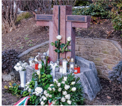
Tornai Endre András által készített emlékmű Deutschlandsbergben, a baleset helyszínén

– A tragédia színhelyére a városból elsődlegesen azok a személyek jöttek el, akik a baleset idején a mentésben is részt vettek. Hetven–nyolcvan fő volt ott a 16.00 óra körül kezdődő eseményen, örömteli, hogy Kőszegről is eljöttek többen, a tragédia áldozatainak hozzátartozói is. Imáink értük szóltak. Először a városi fúvószenekar négy tagja játszott el lágy dallamokat, majd következtek a megemlékezés beszédei. Doris Bund kerületi