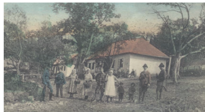
Lakók és látogatók (Képeslap az 1920-as évekből)