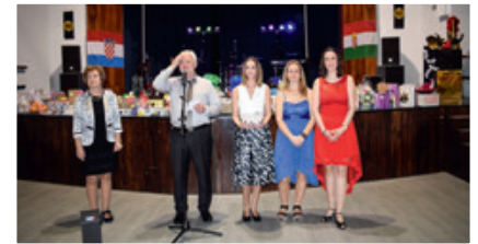
Pukanje i razdiljenje tombolov je bilo dobro organizirano