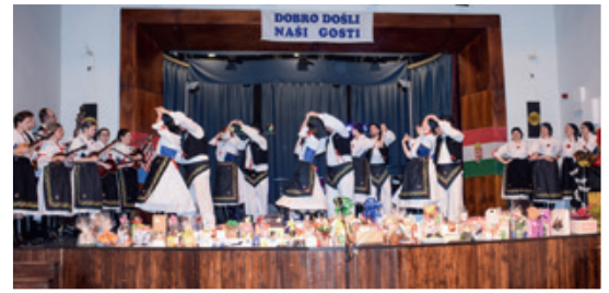
„Hajdenjaki” su bogat kulturni program doprimili